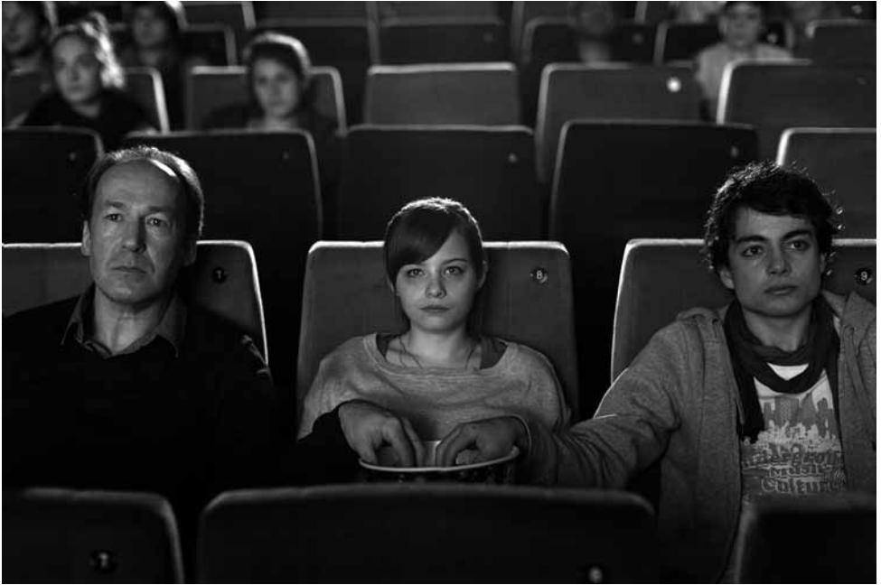
Jasna Fritzi Bauer mit Ulrich Noethen (links) und Max Hegewald in SCHERBENPARK (2013)

stattet ihre um Ruhe und Geborgenheit kämpfende Figur mit erfrischend aggressiven Volten aus und bleibt dabei doch stets auch das Kind, dem man sogleich seine Hilfe anbieten möchte.