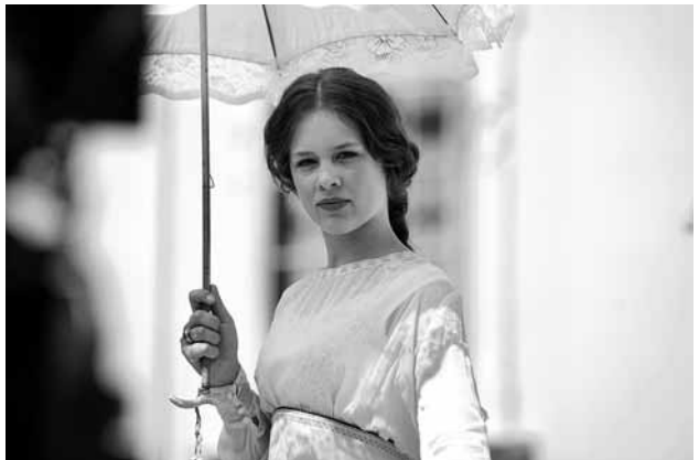
Paula Beer in LUDWIG II. (2012)

Im Jahr 2014 lief Paula Beer wieder zur Hochform auf. In DAS FINSTERE TAL , nominiert als österreichischer «Oscar»-Kandidat für den besten fremdsprachigen Film, bewies sie als Erzählerin ungeahnte Dialektfestigkeit. Ihre Figur der Bauerntochter in einem abgelegenen Tal hatte es nicht leicht. Zwar weckte ein Fremder ihre Neugier auf das Leben außerhalb der engen Dorfgemeinschaft. Aber die Erziehung zum Gehorsam blockierte zugleich jeden Impuls zur Emanzi-