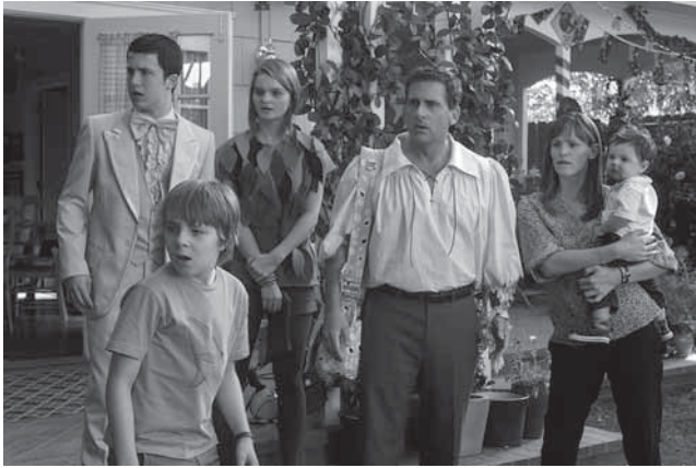
DIE COOPERS – SCHLIMMER GEHT'S IMMER (Disney)